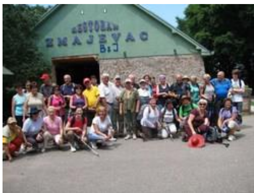
zajednička pred domom Zmajevac