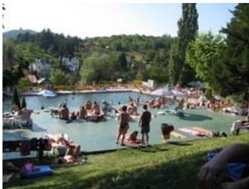
termalno kupalište u Vrdniku