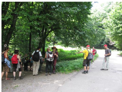
Na grebenu, ulaz u Plavu stazu ka Vrdniku