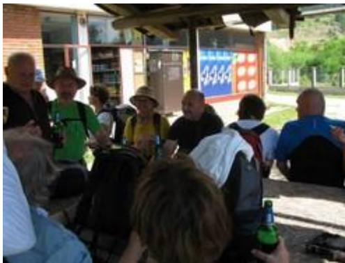
na domak Vrdnika - hladno pivo spas