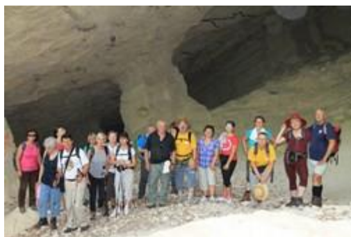
lokalitet Beli Majdan