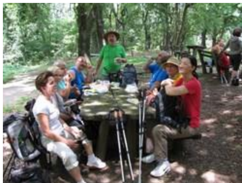
okrijepa kod doma Zmajevac