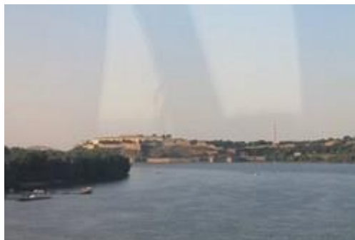
pogled iz busa na Dunav i Petrovaradin