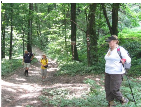
Plava staza ka Vrdniku