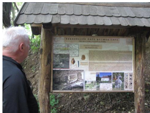
Info tabla "Beli majdan"