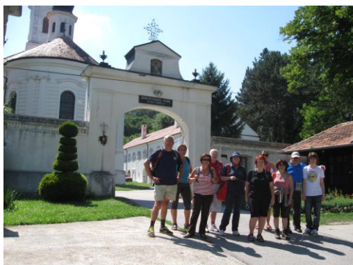
Ispred manastira Nova Ravanica – Vrdnik