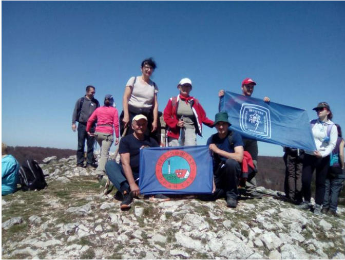
На врфу Бељанице 1339 мнв