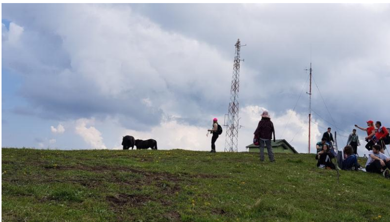
На врху Столова, Усовица 1375 мнв