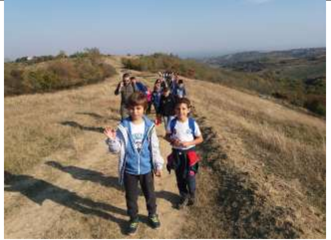
На "црној стази број 4" којом се од Петроварадина (окретница БУС-а број 3) може стићи до планинарског дома "Стражилово" на Черату