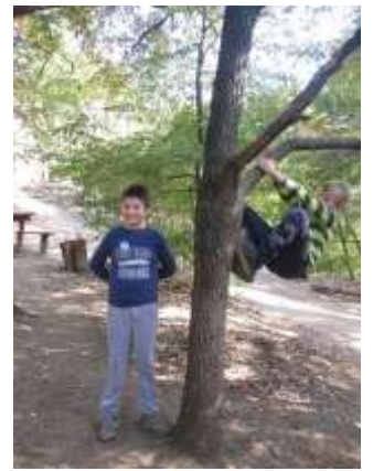
Игралиште у шуми испред Дома Љуљашка у шуми испред Дома