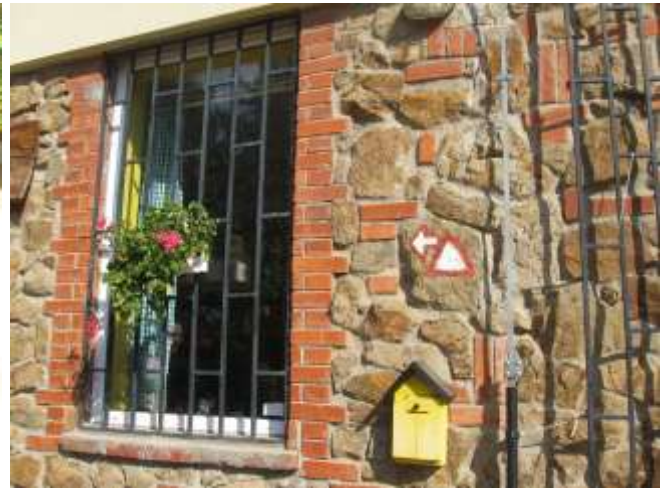
Планинарски дом "Стражилово" на Черату је почетак (КТ1) Фрушкогорске трансверзале.