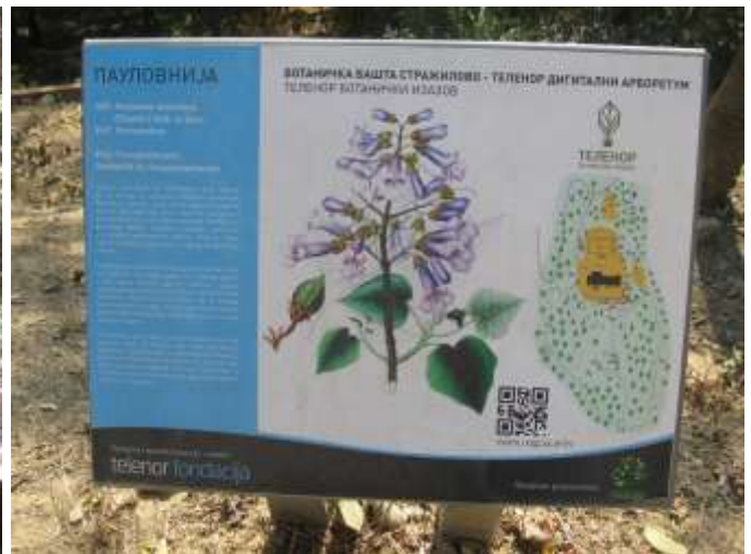
Учионица на отвореном, ботаничка башта Стражилово – видео игрица Арборетум – инфо табле испред Дома