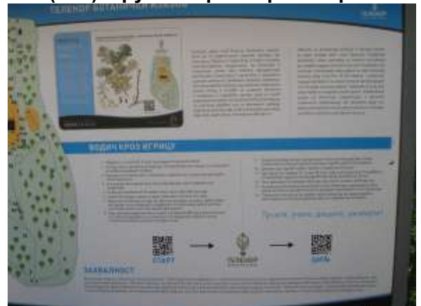
Инфо-табла за видео игрицу Арборетум, ботаничка башта око Дома. У игри је 50 биљака.