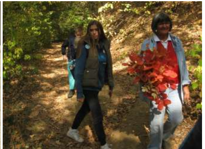
Са букетом руја ка стражиловској долини