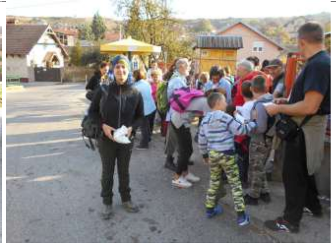
Катарина дели учесницима беџеве и флајере