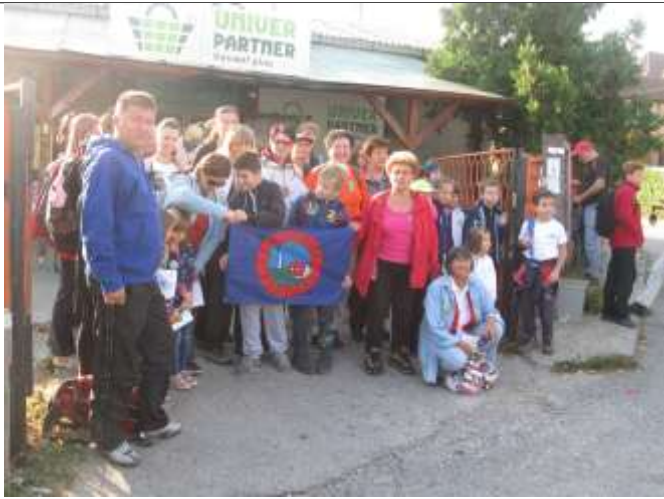
Пре старта снимак за успомену у Буковцу