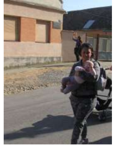
Стигли смо у Буковац