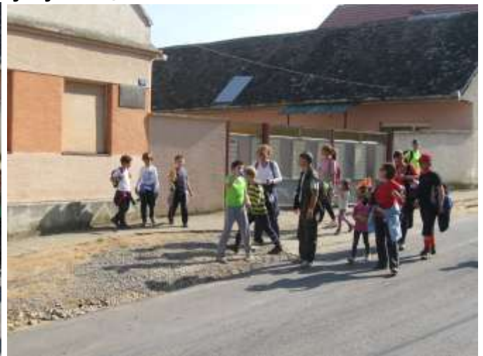
Испред родне куће песникиње Милице Стојадиновић - Српкиње