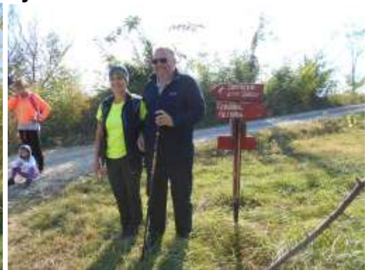
Путокази на "Авали", снимци за успомену