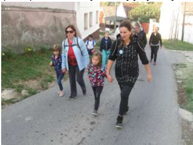
На излазу из Буковца ка Стражилову, око нас разне боје руја