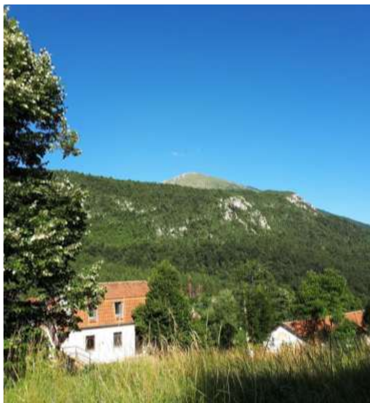
Fotografije i tekst: Katarina Paljić