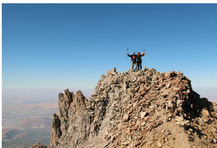
Na vrhu ERCIYES 3916 m