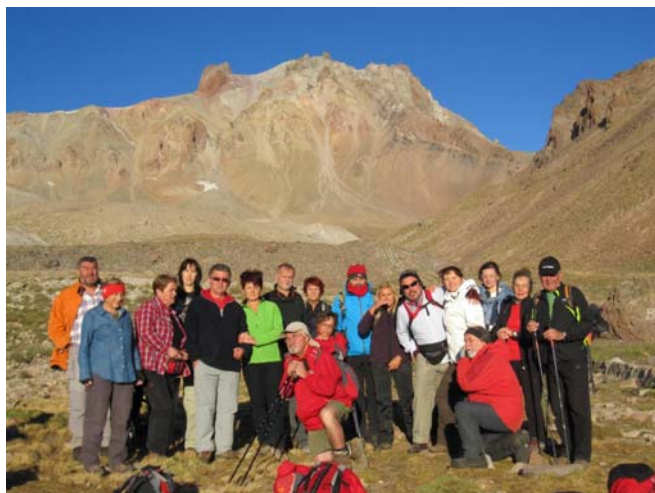
U krateru ERCIYES - a pred usapon, Foto: Suzi

Do tada uživajte u slikama, a pročitajte i putopis koga je sačinila Helena Tudik . Da ne bi gubili na vremenu opis slika dolazi naknadno!! Kada kliknete na sliku dobit ćete sliku odgovarajuće rezolucije, koju možete korigirati da se izradi slika.