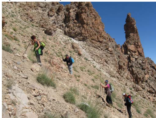
Kolona na usponu kroz kuloar ERCIYES, Foto: Bora