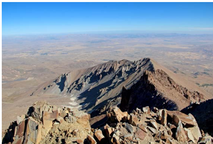
Pogled sa vrha ERCIYES, 3916 m, preko Malog Erciyesa

Peti dan, 06.09. Ustajanje oko 07:00h, priprema za polazak i doručak.