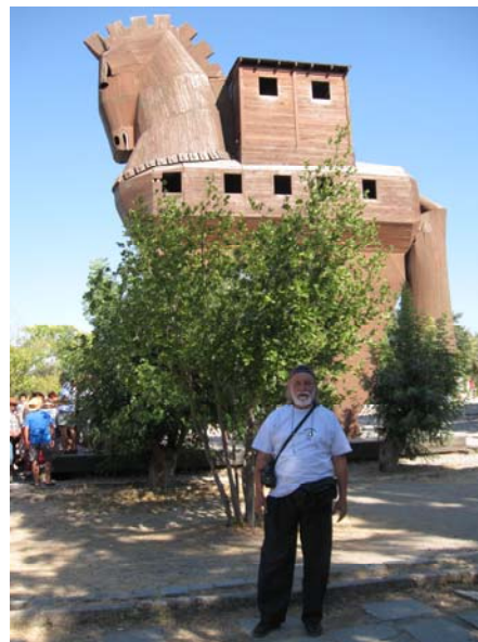
Na ulazu u arheoloski lokalitet TROJA

Deseti dan, 11.09. Tursku napuštamo na graničnom prelazu Edirne . Pred nama je poslednja noć u putovanju kroz Bugarsku ka Srbiji i Hrvatskoj. Hvala svim učesnicima na pokazanoj izdržljivosti u realizaciji ovog programa, a posebno vozačima koji su nas udobno i bezbedno vozili.