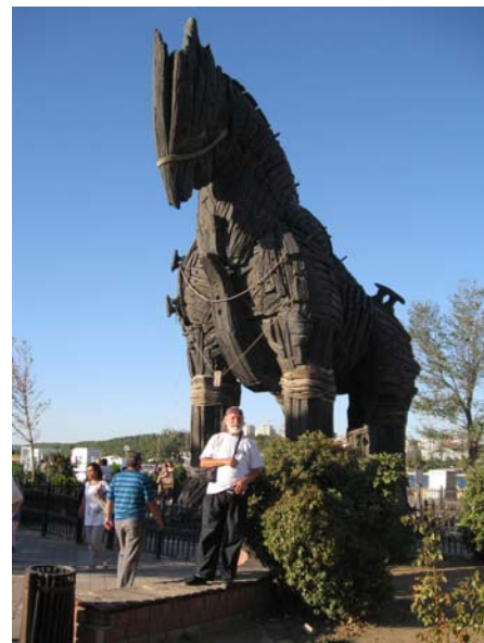
Iz filma „TROJA“ u Canakaleu

Trudio sam se da i vi kroz sliku osjetite kako nam je bilo, a bilo je jako lijepo. Nadam se da mi nitko neće zamjeriti ako sam što propustio ili nešto izostavio, a vi mislite da je važno. Vjerujte mi nije u nikakvoj lošoj namjeri.