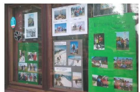
Оверава водич / вођа пута / учесник из ПСД „Поштар“ Н. Сад: