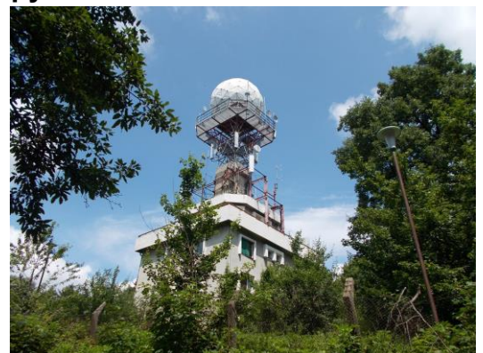
Аранђеловац и печачење до врха Букуље