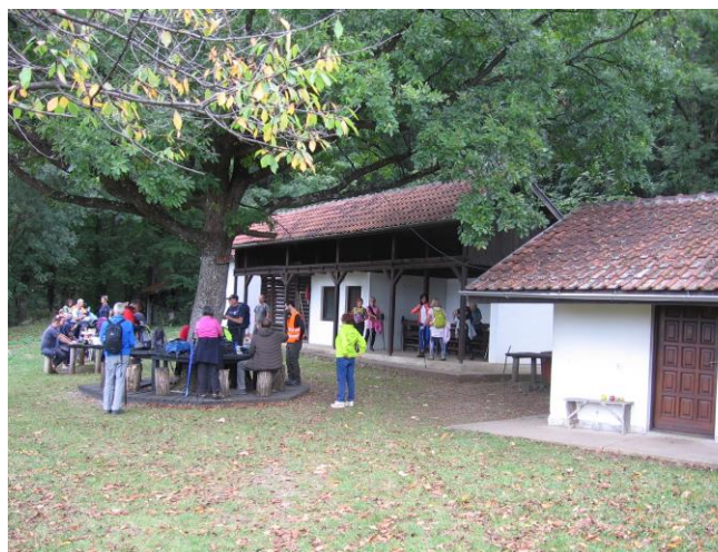
Оверавају водичи из ПСД „Поштар“ Нови Сад: Милан др Бреберина и Душко Косјер