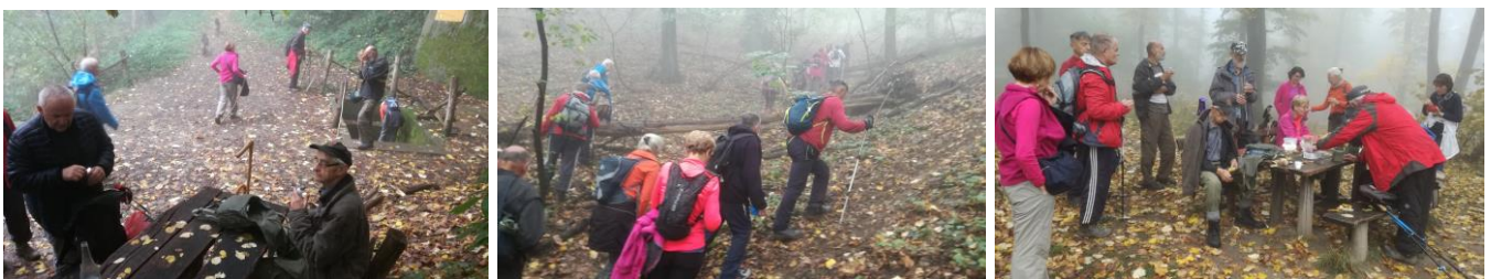
После 4 сата пешачења пријао им је топао оброк када су се вратили у Дом.