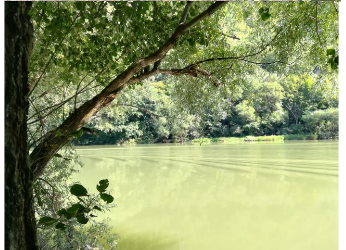
Снимио: Иван Татомиров и учесници акције Извештај поднео учесник из ПСД „Поштар“ Нови Сад: Иван Татомиров Оверава водич ПСС из ПК „Балкан“ Београд: Страхиња Марјановић