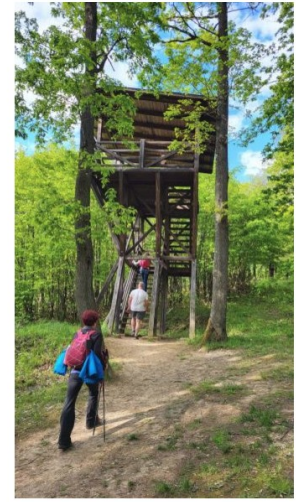
Повратак назад низ поток Орег-Халас, "Бонус" видиковоц пред повратак,