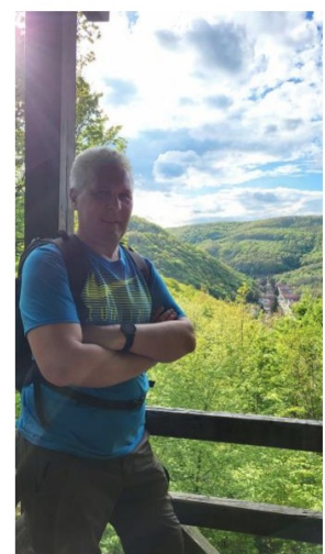
Повратак назад низ поток Орег-Халас, поглед са Видиковца на село Обања, одакле смо кренули

Толико од мене. Нисам ни ни близу добар фотограф да верно дочарам лепоте овиих предела, па ми једино преостаје да позovem друштво да једном посетимо Мечек заједно. извештава Иштван Просингер, ПСД Поштар