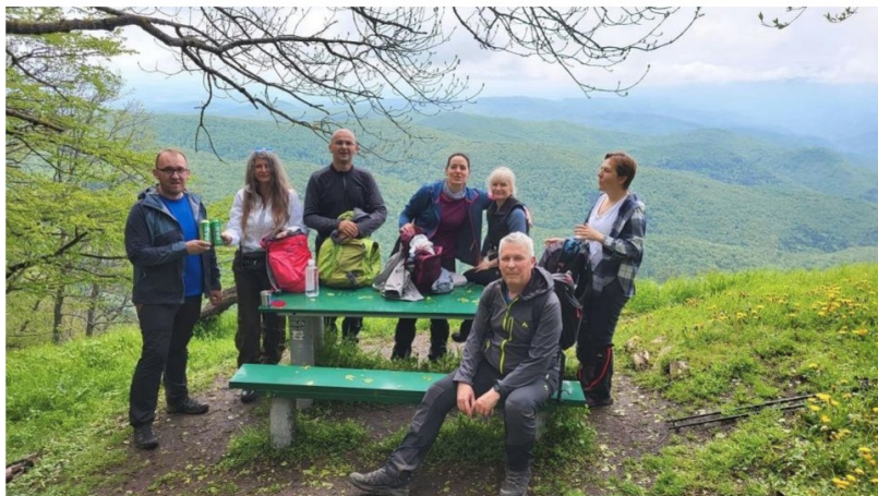
и Зен клупица на Папуку

Одатле се другим гребеном спуштамо ка Јанковцу, успут посетивши највећу пећину Папука, Увиралка. Након ручка у Јанковцу, крећемо на Грофову стазу. То је едукативна стаза око језера Јанковац дужине 2км, која се завршава на водопаду Скакавац. Водопад, одн "Слап Скакавац" је висок 35м, и убедљиво је најјачи утисак са целе акције (поред гостопримства домаћина), који од срца препоручујем свима.