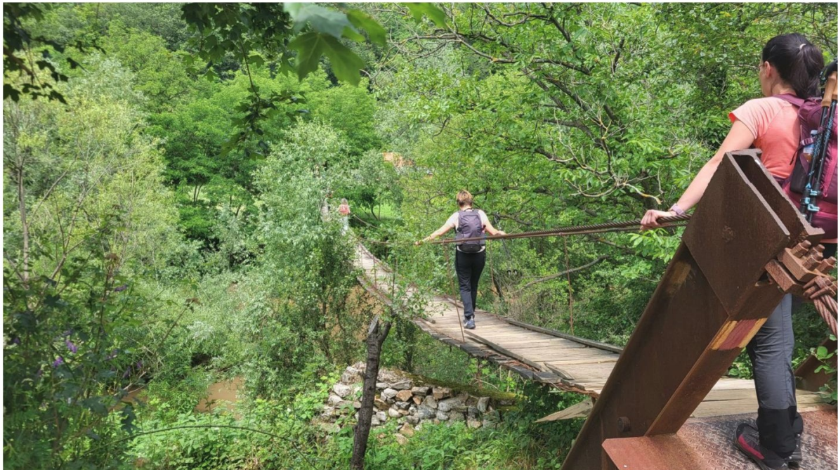
Висећи мост изнад Нере

Ја сам се одлучио да идемо до малог Румунског села Саска Романа, од Суботице удаљеног око 300км и мало више од 4h вожње (од Новог Сада око 220км и наводно 3.5h вожње). Успели смо са мини бусом да дођемо до једног паркинга који се налази 10-ак метара од висећег моста на Нери, где авантура и почиње.