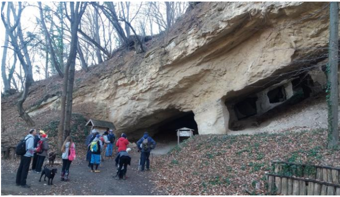
Пећина „Бели мајдан“