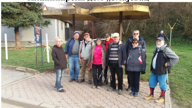
Стајалиште БУСа код манастира Раковац