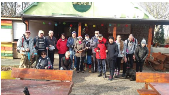
Планинарски дом „Змајевац“