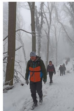
Ка Павласовом чогу