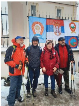
Заставе на старту