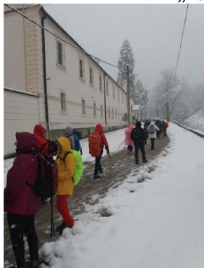
Код манастира Беочин