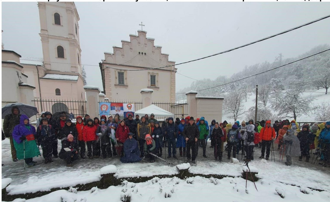
На „23. Меморијалу Игњата Павласа“ било је 109 учесника