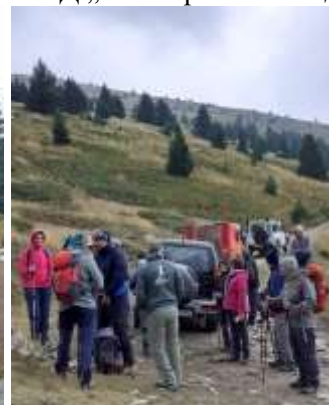
Полазак ка врху Пелистер