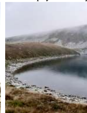
Големо езеро 2218 мнв