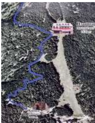
Молика - Копанки