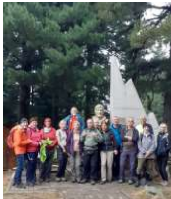
Споменик „Мурато“ код пл. дома „Копанки“