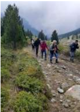
Успон ка врху