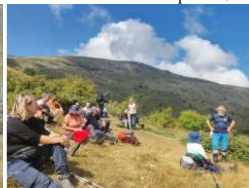
Весело расположење у Дому Снимак испред дома „МУРАТО“(2218) Силазак ка Нижерполе

Četvrta deonica planinarske ekskurzije kroz Severnu Makedoniju sa HPD "ZAGREB MATICA" iz Zagreba: Trećeg dana boravka na planini Baba pešaćili smo od Golemog jezera do sela Nižepole (1170 mnv).Autobus nas je čekaо u selu.