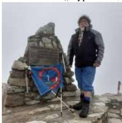
На врху Пелистер 2601 мнв