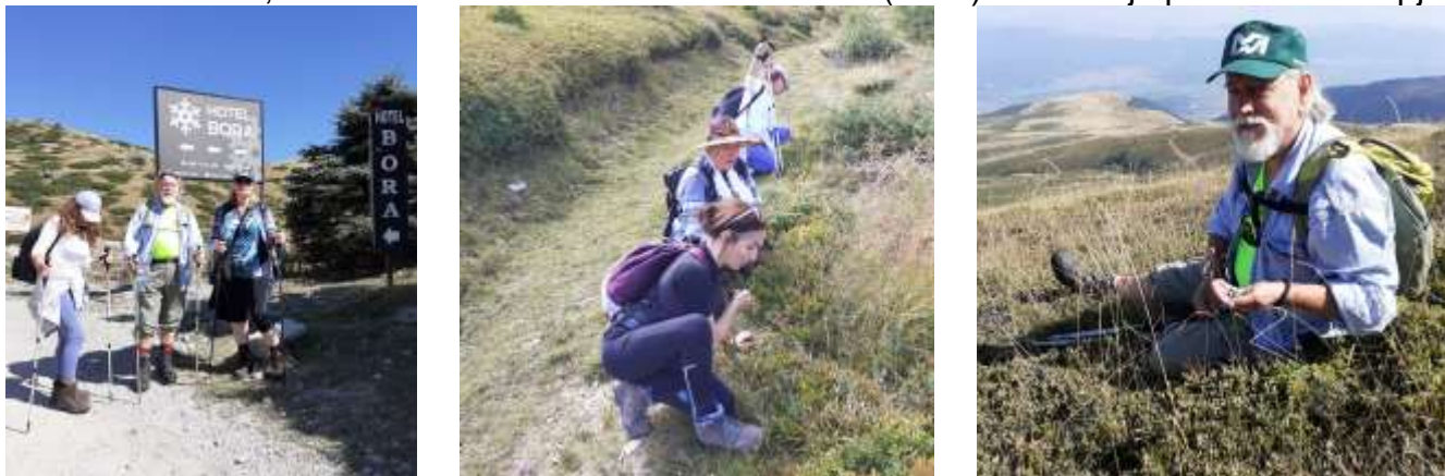
На успону ка врху Церопашино 2450 мнв