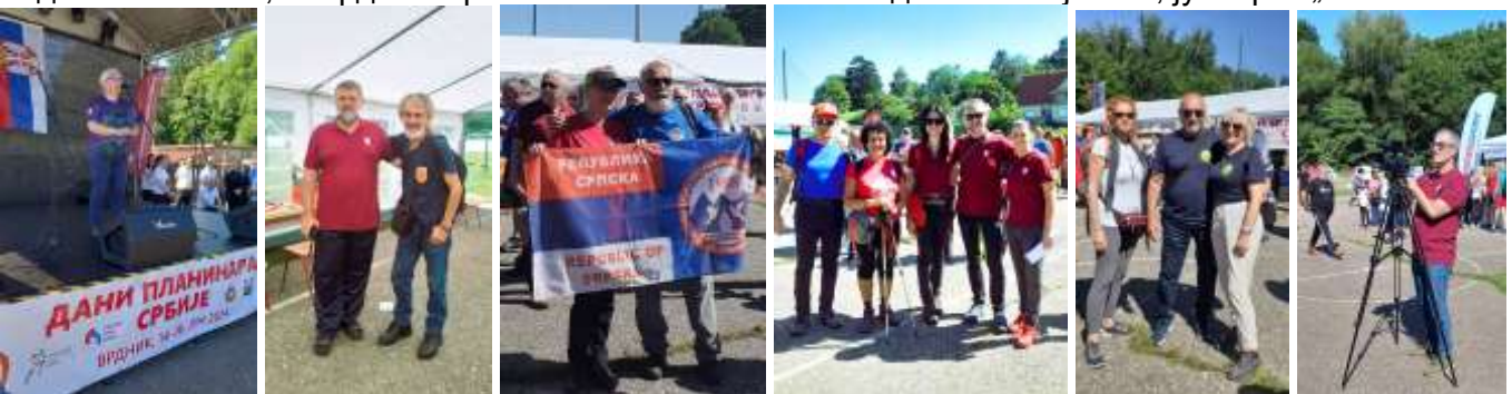
Рума Нови Сад Краљево Бијељина Бања Лука Бајина Башта Прибој Ивањица Крушевац