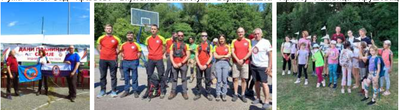
Пријатељи, Нови Сад - Осијек