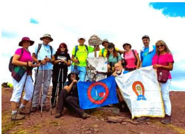
Стара планина, Миџор 2169 мнв

Опис акције: Нашим аутомобилима довели смо се до Планинарског дома „Миџор“ (1548), у подножју камених стена „Бабин зуб“ (1758). Пешачимо 500 м до „Сунчане долине“ и ресторана „Плажа“ (1577). Отварање акције и полазак на стазу ка Миџору (2169) повратак истом стазом. Успон је у првом делу колски пут. Обилази се Жаркова чука 1850 мнв са леве стране и продужава ка Тупанару. На означеној раскрсници испод Тупанара ишли смо право ка Миџору 2169 мнв. Укупна дужина пешачења данас била је 17 км.