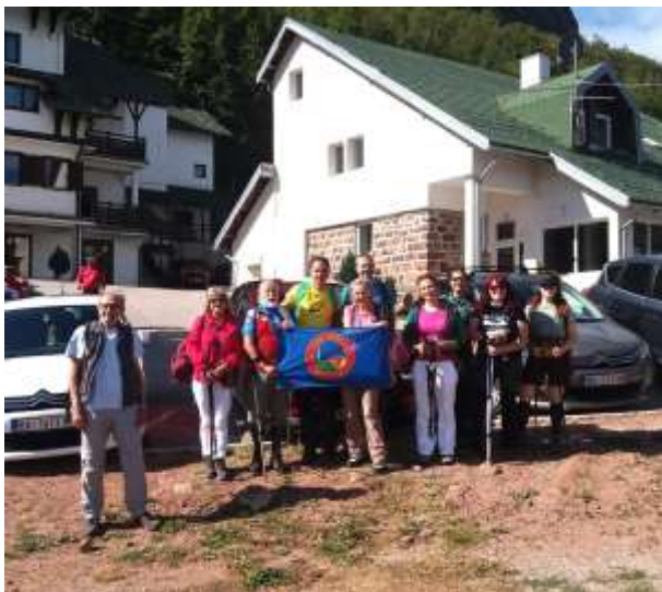
Планинарски дом „Миџор“ (1548) - Бабин Зуб