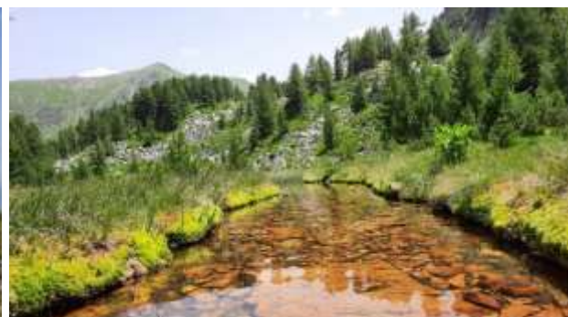
Ispod vrha Mali Starac nalazi se izvor sa vodom i malo jezerce