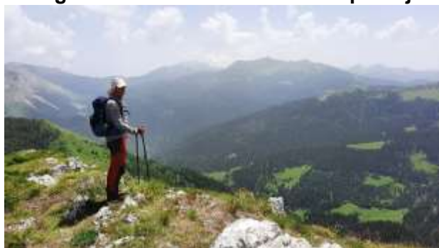
Planinica 2050 m