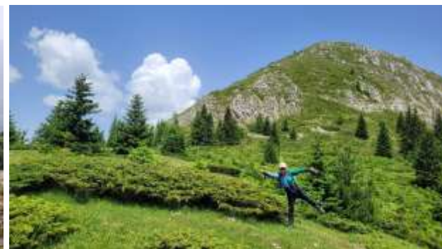
Planinica 2050 m