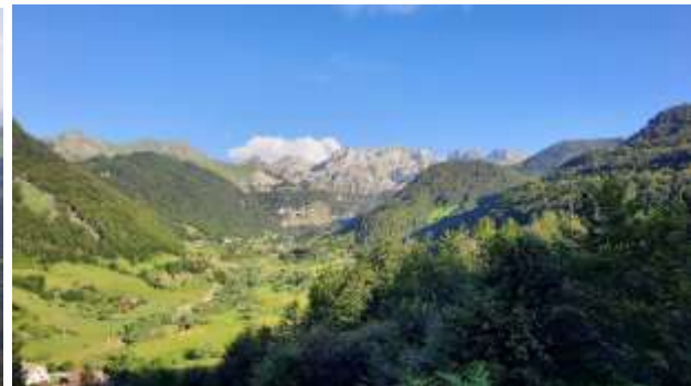
Selo ispod Popadije - Lepuša ( Lepushë )