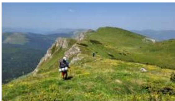
Maliji Nedžinat 2275m

Na mestu gde nam je ispod grebena desno katun Malsor napuštamo markaciju i silazimo desno u korito potoka koji se uliva u reku Pećka Bistrica.