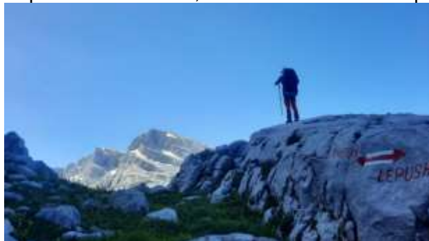
Vrh Šnikut 2552m u daljini

Popeli smo se na vrh, uživali i vratili se u kamp.