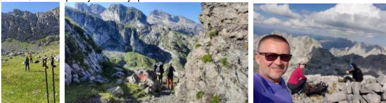
Katuna ispod vrha Šnikut Polazak za vrh Šnikut 2552m Vrh Šnikut 2552m (Maja e Madhe)

3 dan Odlazak do katuna ispod vrha Šnikut ( Maja Madhe ). Katun nije aktivan nalazi se na 1800m. Do njega sa 1750m nadole do 1600m, pa ponovo na prevoj 1900m do katuna koji je na 1800m. U katunu postoji izvor ali je presušio.