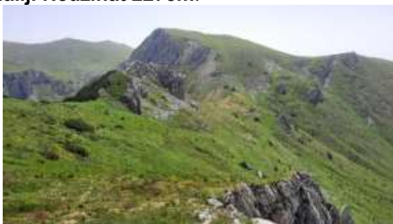
Vrh Liqenati 2339m

7 dan Polazak prema kolima na prevoju Čakor grebenom preko vrha Liqenati 2339m i Maliji Nedžinat 2275m.