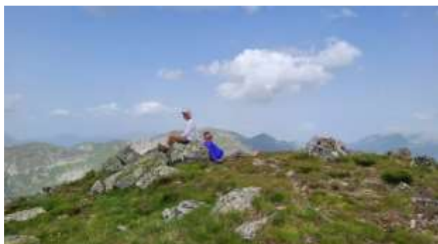
Vrh Bandera od starca ( Crni krš ) 2426 m