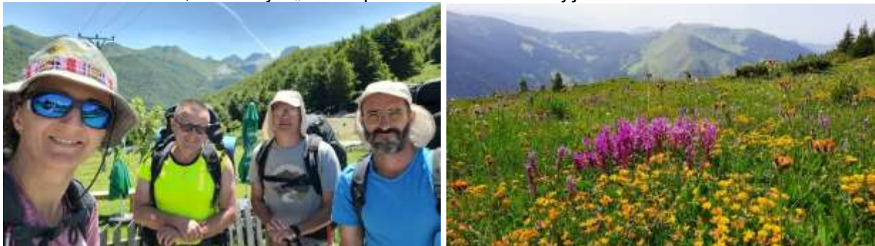
Lepuša ( Lepushë ).

1 dan Odlazak u Plav, Smeštaj u „Sara apartmanima“. Smeštaj je dobar a cene normalne.