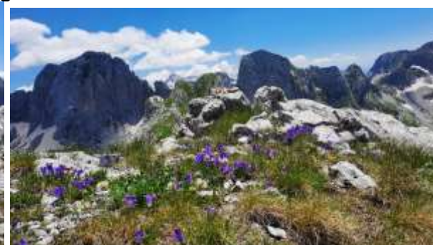
Sa vrha Nigvacit 2412m