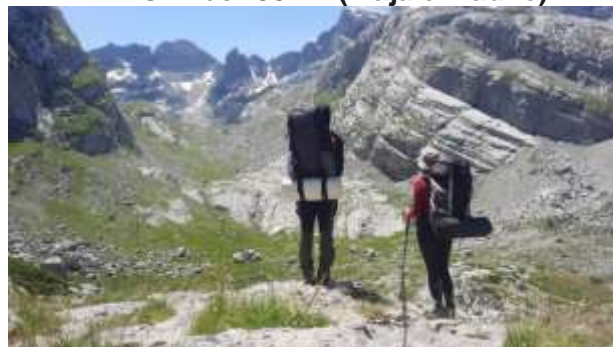
Katuna ispod vrha Šnikut (Maja Madhe)

4 dan Pakovanje, i sa rančevima pravac vrh Nigvacit 2412m.