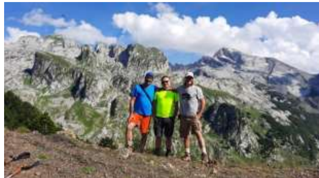
Uspon na Maja Berizhdolit 1979 m

U katunu Berizhdolit prvi put voda sa izvora tog dana, gde se malo odmaramo na izvoru i krećemo do kola u Lepuši, U kafani se pošteno hidriramo. Kupanje ispred vodopada reke Vermosh u veoma hladnoj vodi ( Sada znam zašto su oni na Titaniku izdržali samo 10 minuta ). Odlazak u Crnu Goru i spavanje u Plavu u istom smeštaju.