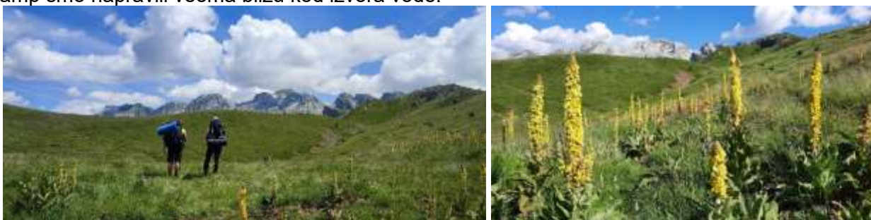
Katun (1750 m) ispod vrha Maja Berizhdolit.

Kamp smo napravili veoma blizu kod izvora vode.