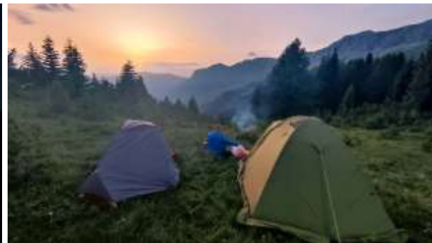
Prevoj Pusi i Plaves 2035 m