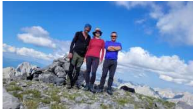
Vrh Šnikut 2552m (Maja e Madhe)