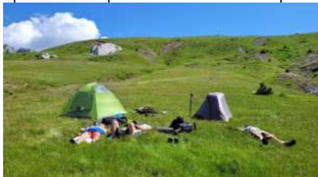
Katun (1750 m) ispod vrha Maja Berizhdolit.

Na prevoju ispod vrha ( 2100m ) ostavljamo rančeve i samo sa vodom penjemo vrh. Spuštamo se u pravcu katuna Berizhdolit preko prevoja Shkembejt e James.