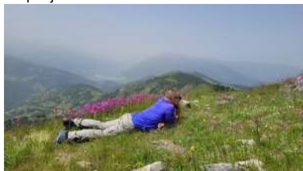
Devojački krš 2050m.