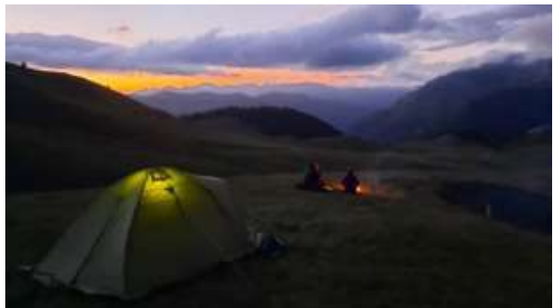
Katun (1750 m) ispod vrha Maja Berizhdolit