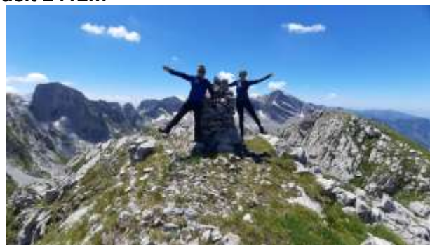
Vrh Nigvacit 2412m